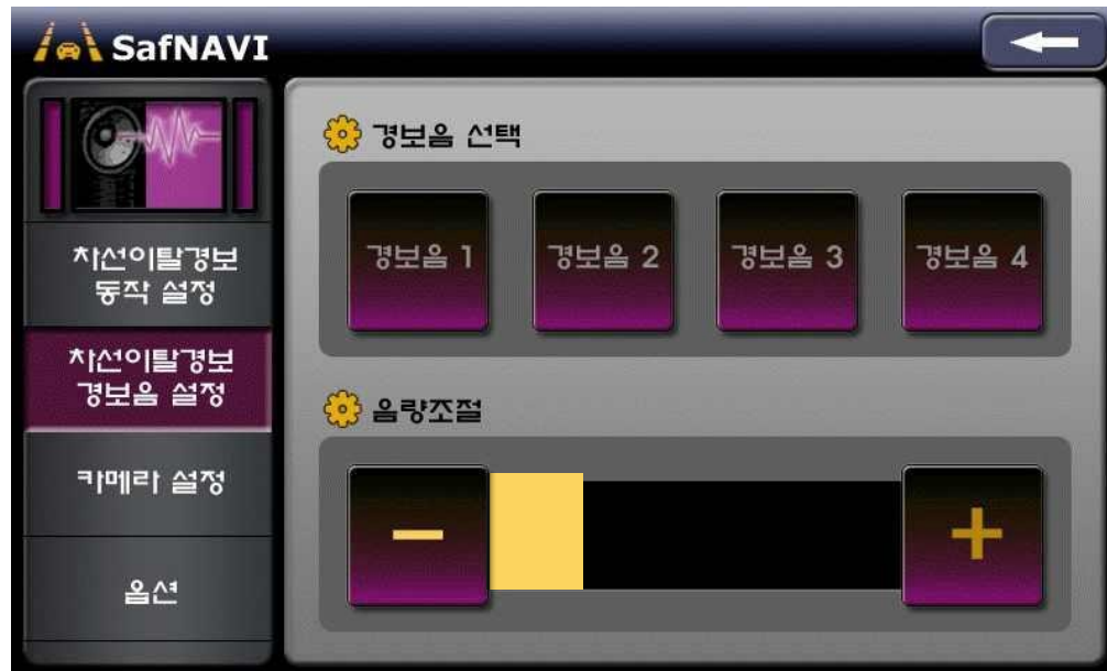
[차선이탈 경보음 설정화면]